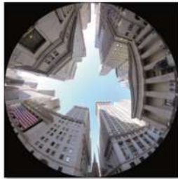
view up 025