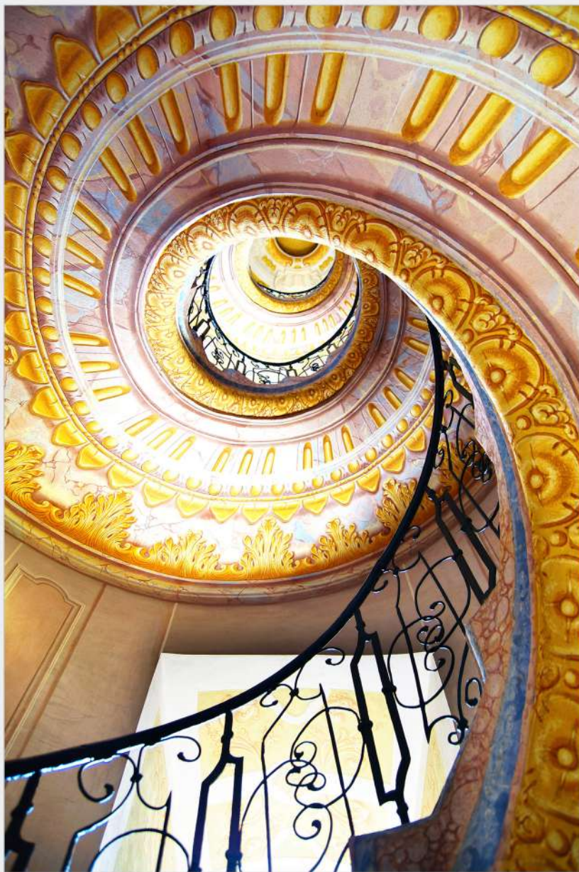
|view up 046|