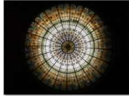
view up 050