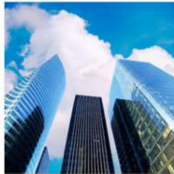
view up 013