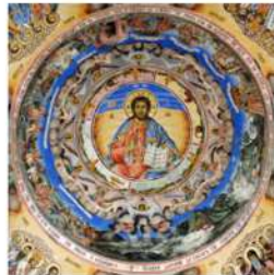
view up 039