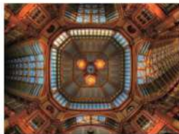
view up 037