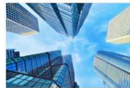
view up 016