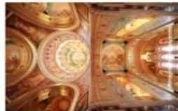
view up 038