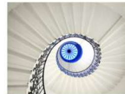
view up 041