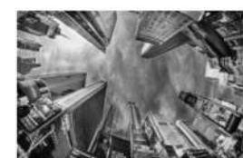
view up 024