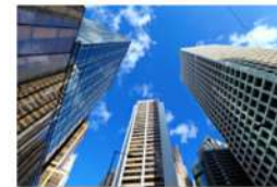
view up 017