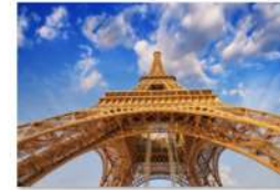
view up 011