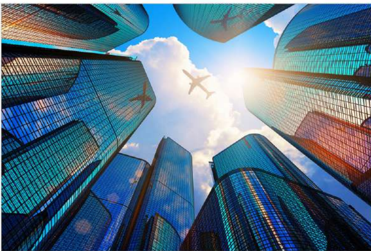
|view up 049|