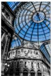
view up 031