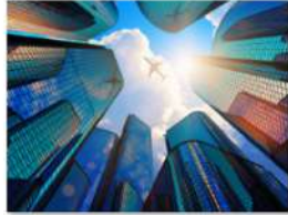
view up 049