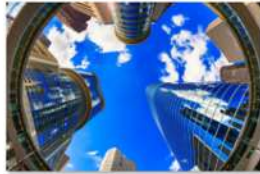
view up 055