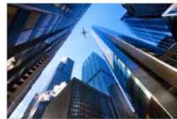
view up 015