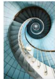
view up 044