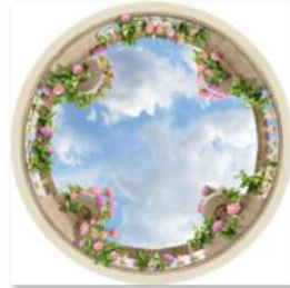
view up 052