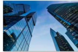
view up 059