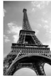
view up 028