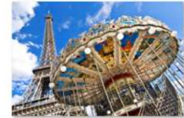
view up 012