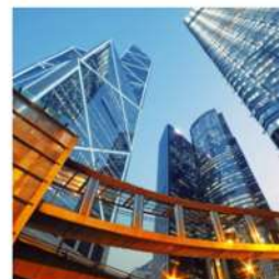
view up 021