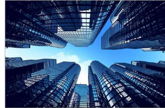
|view up 023|