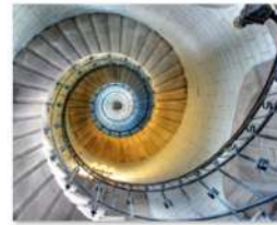
view up 004