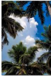
view up 056