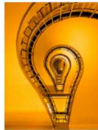
view up 045