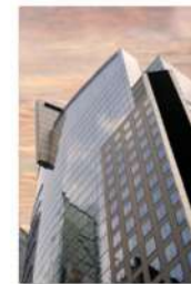
view up 035