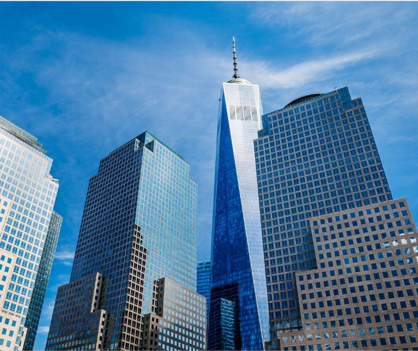
view up 020