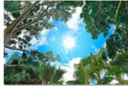
view up 057