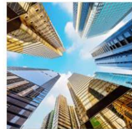
view up 048