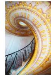
view up 047