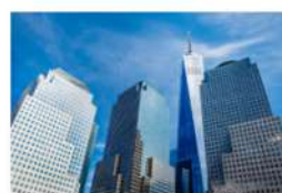
view up 020