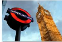
view up 008