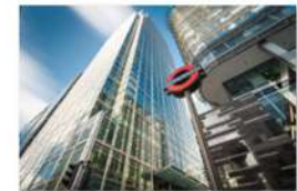
view up 018