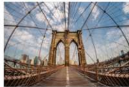
view up 032