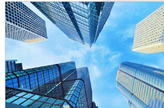
|view up 016|