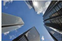
view up 062