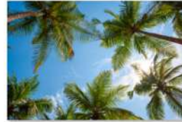
view up 060