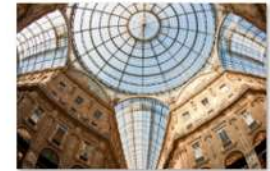
view up 030