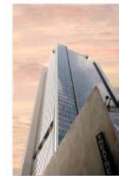
view up 036