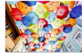
view up 006