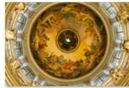
view up 003