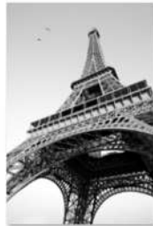
view up 027