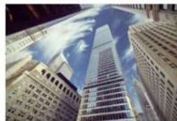
view up 019