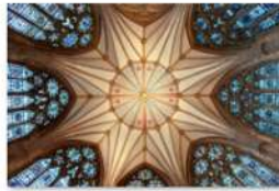
view up 001