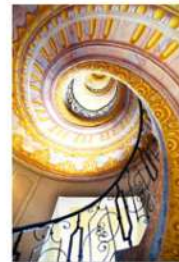
view up 046