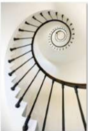
view up 043