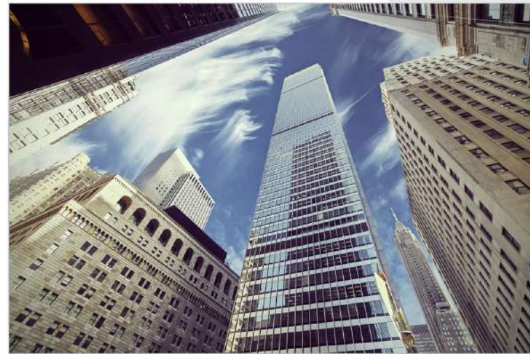
|view up 019|