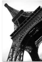
view up 009