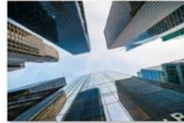
view up 054