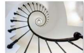
view up 042