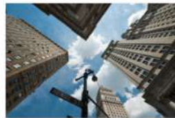
view up 014