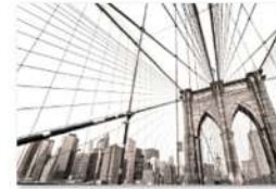
view up 005