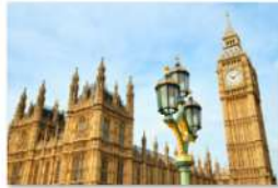
view up 007