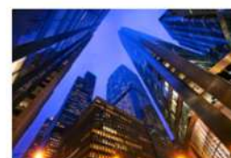
view up 022