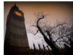
view up 040