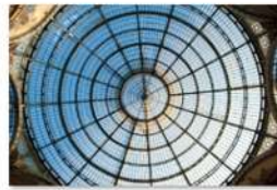
view up 002