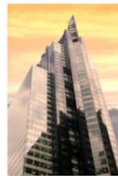
view up 034