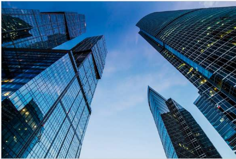
|view up 059|