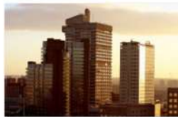
view up 033