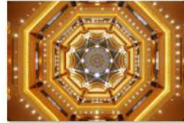
view up 053