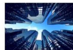
view up 023