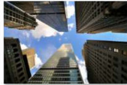
view up 051