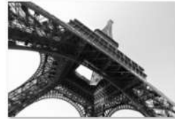
view up 010