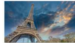
view up 029