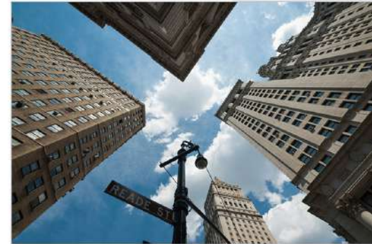
|view up 014|