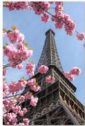
view up 026